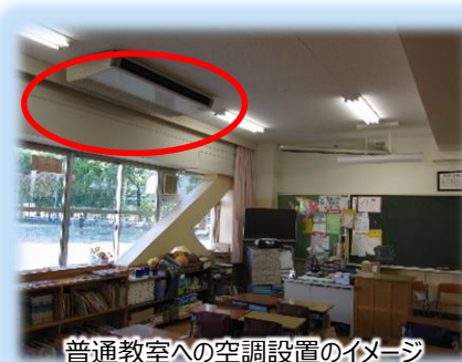
普通教室への空調設置のイメージ