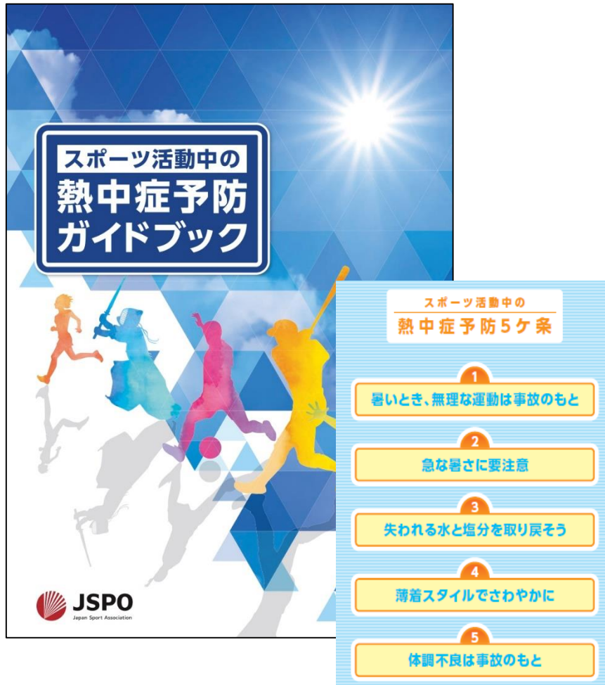
スポーツ活動中の熱中症予防ガイドブック