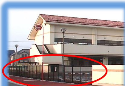
敷地境界へのフェンス設置のイメージ