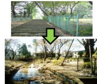
河川と公園との一体的な再整備