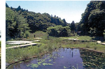
都市に残された緑地の保全