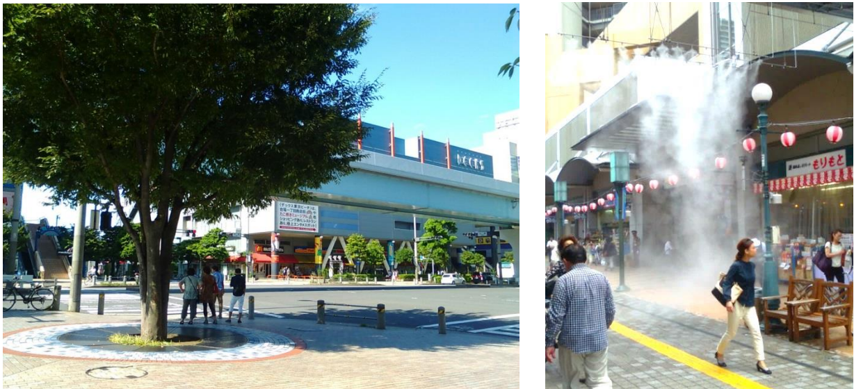
図 2 交差点近くの木陰（左）と商店街での微細ミスト対策（右）

これまでの暑さ対策は、個々に日傘をさす、打ち水をするなどのソフトな取り組みを中心に行われてきました。しかし、気候変動による気温上昇は今後も一定程度進むことが予測されており、まちなかの暑さはより一層、厳しさを増す可能性があります。そのため、まちなかの暑さ対策にも積極的に取り組んでいくことが重要となります。