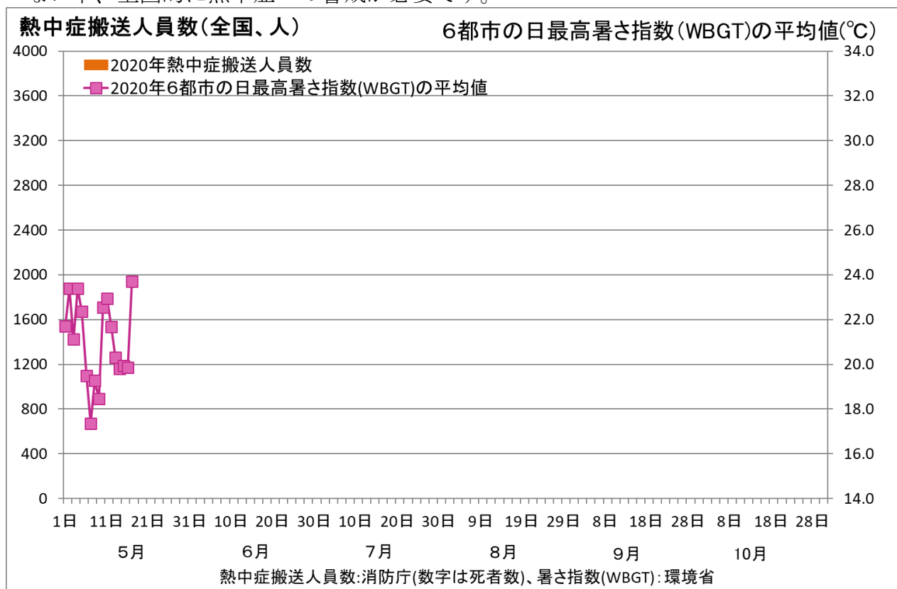
図2 6都市の日最高暑さ指数(WBGT)の平均値と熱中症搬送人員数の推移

※消防庁の熱中症による救急搬送人員の調査は、新型コロナウイルス感染症をめぐる現状等に鑑み、今年の調査開始を当面延期すると発表(令和2年4月23日消防庁報道発表資料より)