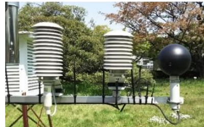
暑さ指数(WBGT)測定装置

暑さ指数を用いた指針としては、(公財)日本スポーツ協会(元日本体育協会)による「熱中症予防運動指針」、日本生気象学会による「日常生活における熱中症予防指針」があります。