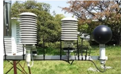
暑さ指数(WBGT)測定装置

暑さ指数を用いた指針としては、(公財)日本スポーツ協会(元日本体育協会)による「熱中症予防運動指針」、日本生気象学会による「日常生活における熱中症予防指針」があります。