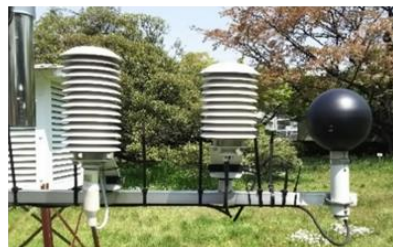
暑さ指数(WBGT)測定装置