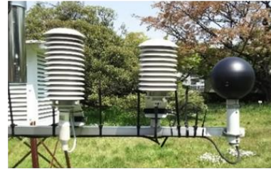
暑さ指数(WBGT)測定装置