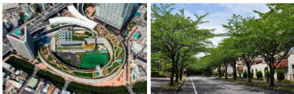
立体都市公園の整備