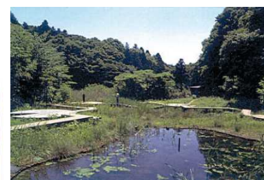
都市に残された緑地の保全