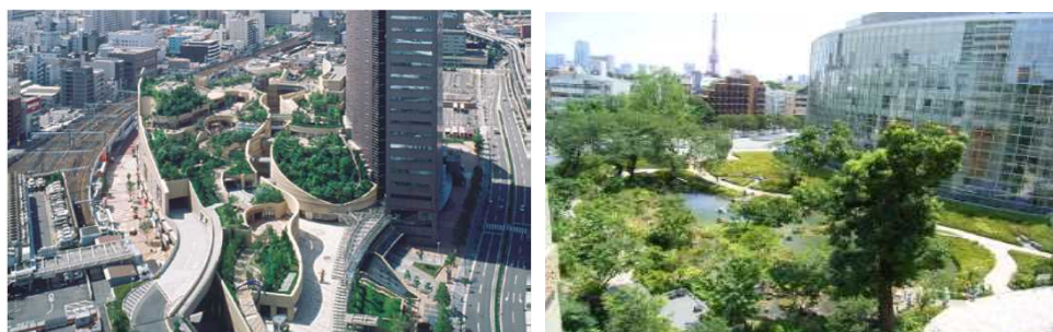
民間建築物等の敷地内緑化