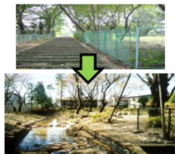
河川と公園との一体的な再整備