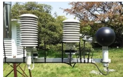
暑さ指数(WBGT)測定装置

暑さ指数を用いた指針としては、(公財)日本スポーツ協会(元日本体育協会)による「熱中症予防運動指針」、日本生気象学会による「日常生活における熱中症予防指針」があります。