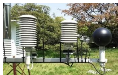
暑さ指数(WBGT)測定装置