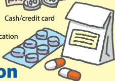
Current medication and schedule